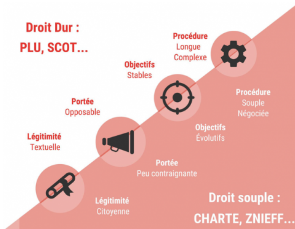
Figure 1 : La complémentarité du droit contraignant dur et du droit souple permettrait une amélioration de la prise en compte de la biodiversité.

pratiques tous les deux ans, la métropole reste garante de la qualité du réseau et du respect de la charte. Cet exemple témoigne de l'intérêt du droit souple à faire infuser des concepts et des pratiques plus favorables à la biodiversité. Il découle ainsi de la complémentarité du droit contraignant et du droit souple une prise en compte potentiellement accrue des enjeux biodiversitaires (Figure 1). Il est nécessaire de préciser que le droit reste un garde-fou nécessaire mais insuffisant pour traiter les enjeux de préservation, restauration et reconquête de la biodiversité en ville.