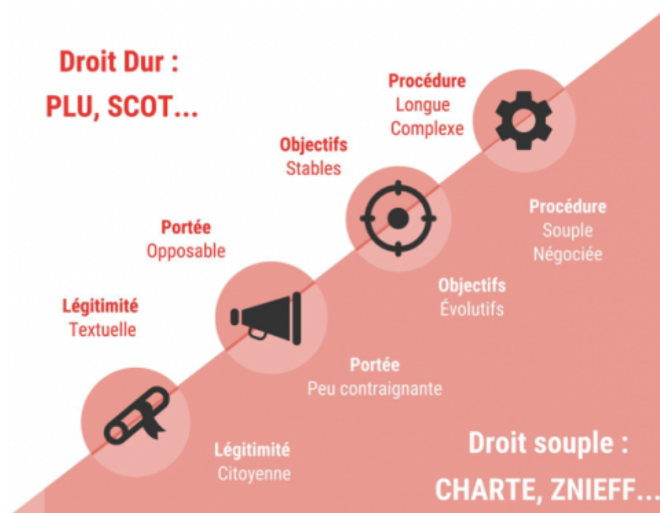
Figure 1 : La complémentarité du droit contraignant dur et du droit souple permettrait une amélioration de la prise en compte de la biodiversité.

pratiques tous les deux ans, la métropole reste garante de la qualité du réseau et du respect de la charte. Cet exemple témoigne de l'intérêt du droit souple à faire infuser des concepts et des pratiques plus favorables à la biodiversité. Il découle ainsi de la complémentarité du droit contraignant et du droit souple une prise en compte potentiellement accrue des enjeux biodiversitaires (Figure 1). Il est nécessaire de préciser que le droit reste un garde-fou nécessaire mais insuffisant pour traiter les enjeux de préservation, restauration et reconquête de la biodiversité en ville.