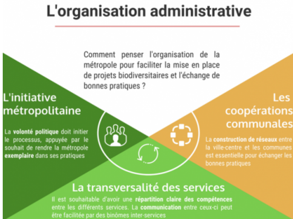
Figure 2 : L'organisation administrative des métropoles est un élément déterminant pour l'émergence d'une prise en compte plus importante de la biodiversité.

administrative et l'organisation cohérente des services peuvent stimuler l'action de la métropole et optimiser son rôle moteur.