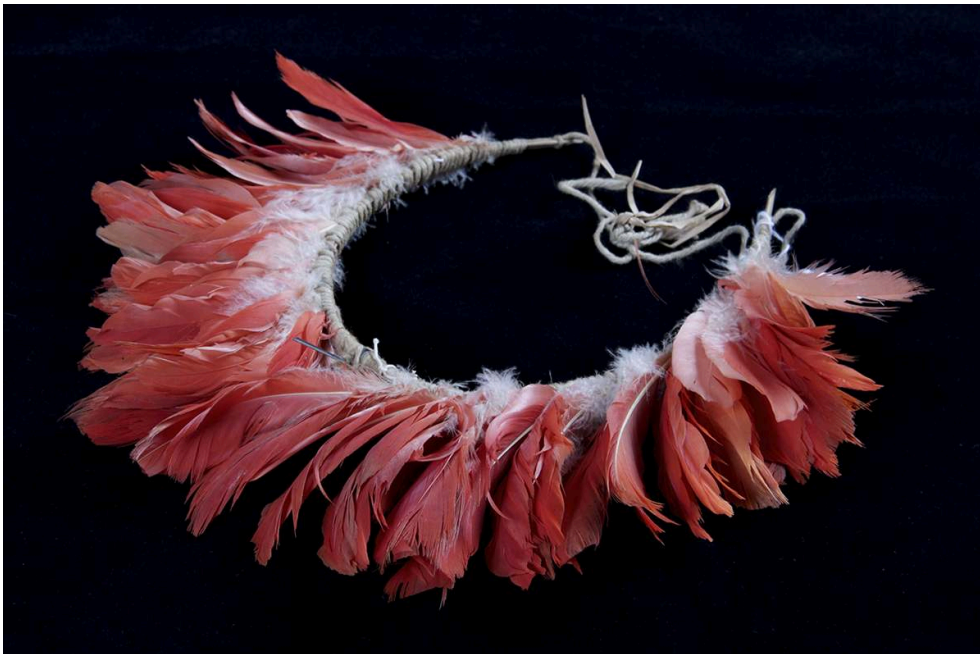
Figure n° 4 – Diadème en plumes d'Ibis rouge, MPEG 2041. Collection Gorotire, 1938 (Carlos Estevão de Oliveira).