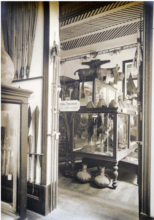
Figure n° 3 – Salle d'exposition de la collection ethnographique du musée Goeldi.