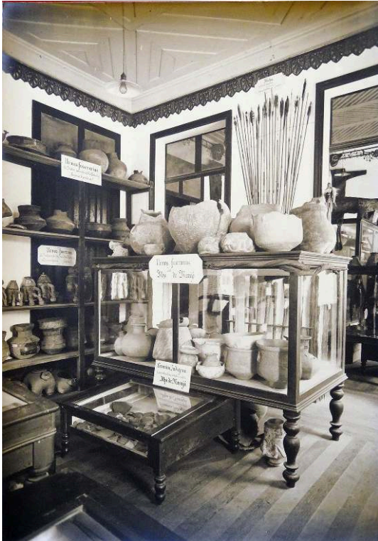
Figure n° 2 – Salle d'exposition de la collection archéologique du musée Goeldi.