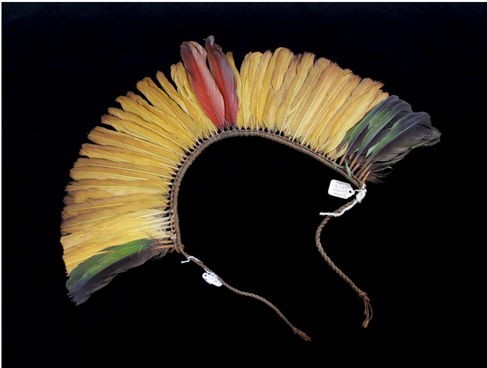
Figure n° 6 – Diadème en plumes de cassique huppé, de perroquet et d'ara sur cordelette en coton, MPEG 2227. Collection Gorotire, 1940 (Curt Nimuendajú).