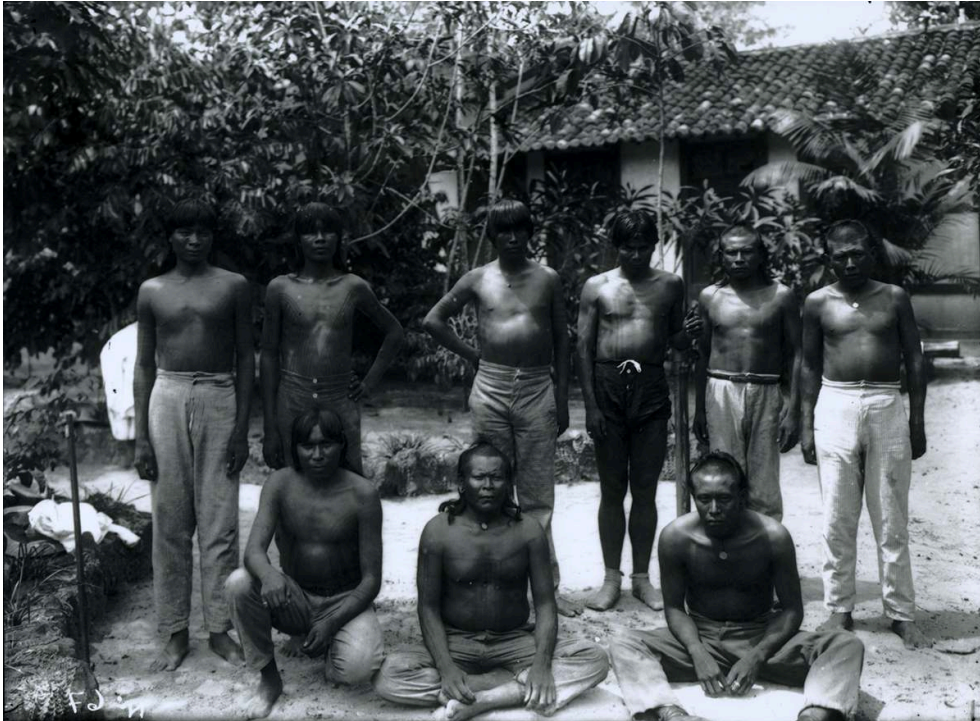
Figure n° 1 – Indiens en visite au musée Goeldi.